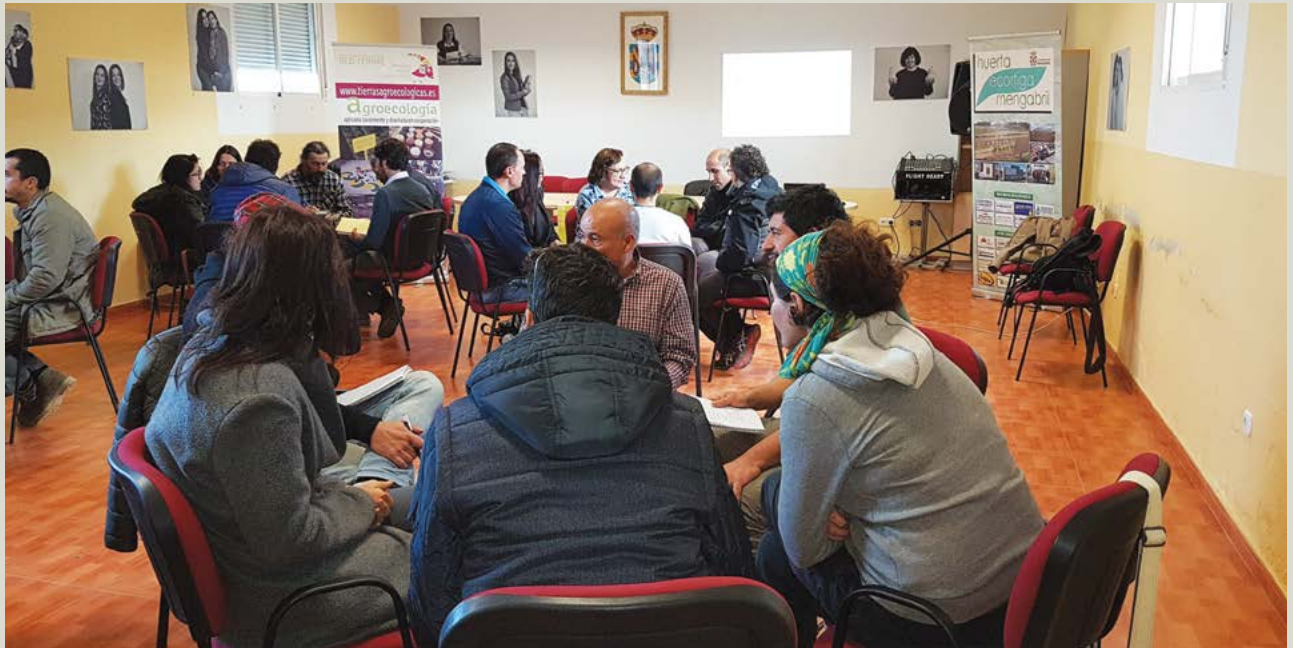
Mesas de trabajo durante el Encuentro "Reconectando a guardianes de semillas" Noviembre 2018 en Mengabril (Badajoz).