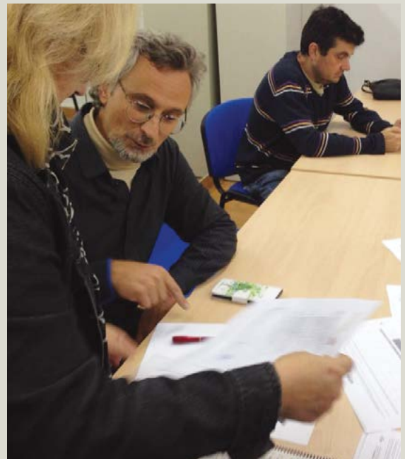
Sesión de asesoramiento de la Red TERRAE sobre el banco de tierras en Carcaboso (Cáceres).

complementariedad entre vacuno, ovino, caprino, apicultura, y otras especies. Las posibilidades de conservación, adaptación y anticipación a los retos del clima y del desempleo, y explorar en condiciones las oportunidades de emprendimiento, repoblación rural y focalización agroecológica y extensiva que tiene la ganadería ecológica y extensiva.